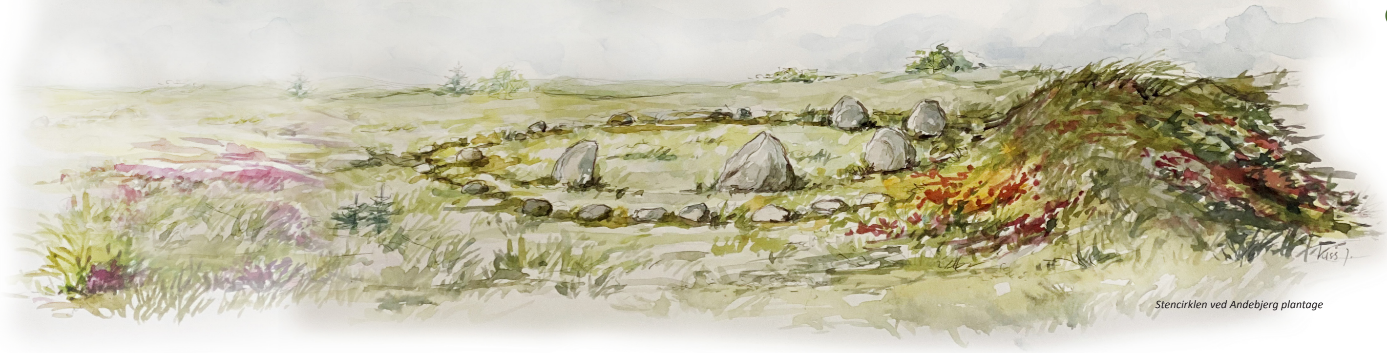
Stencirklen ved Andebjerg plantage