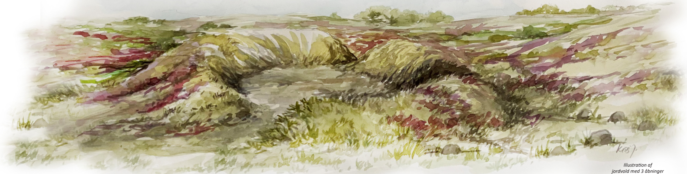
Illustration af jordvold med 3 åbninger