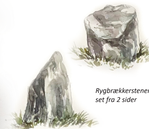
Rygbækkerstenen, set fra 2 sider