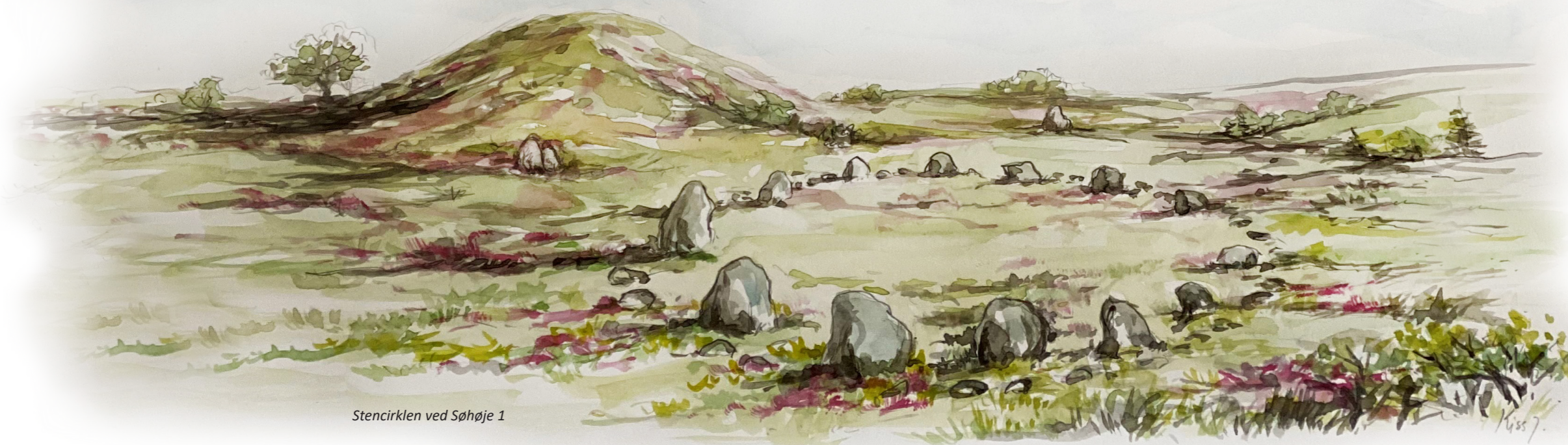
Stencirklen ved Søhøje 1