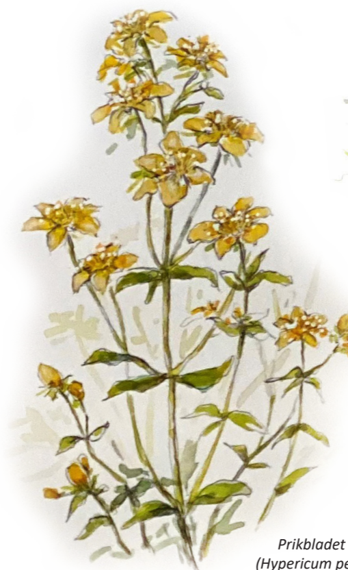
Prikbladet Perikon ( Hypericum perforatum )