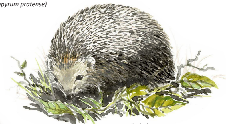
Pindsvin ( Erinaceus europaeus )

Du kan se ruten markeret med gult her på kortet. Vær altid opmærksom på skiltningen. Skoven kan, i forbindelse med jagt og skovning, være lukket – og dermed er adgangen til fortidsminderne også udelukket på disse dage!