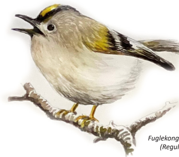
Fuglekonge (Regulus regulus)