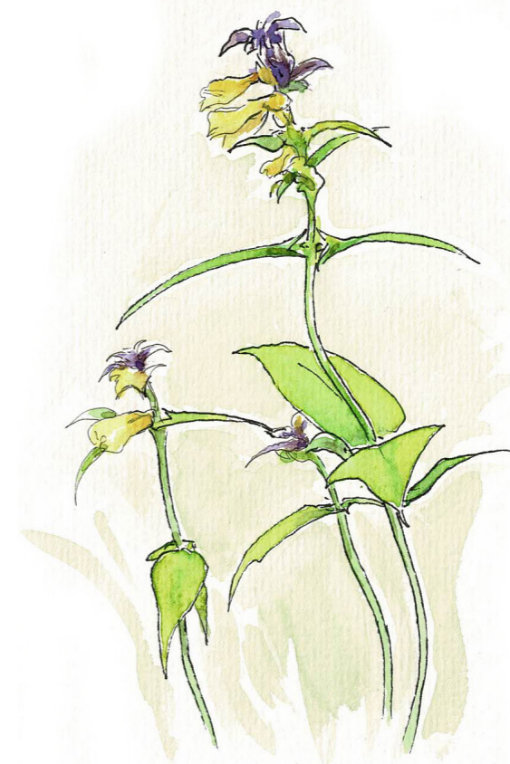
Alm. Kohvede ( Melampyrum pratense )