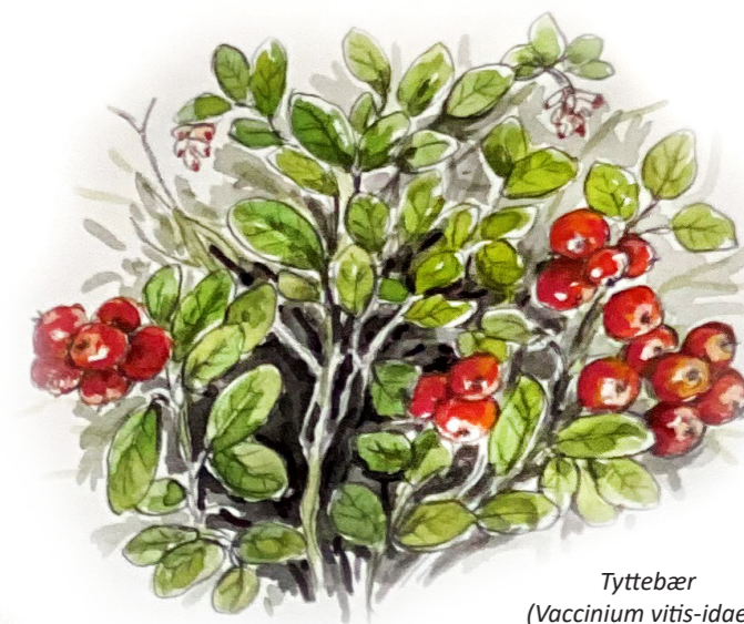
Tyttebær (Vaccinium vitis-idaea)