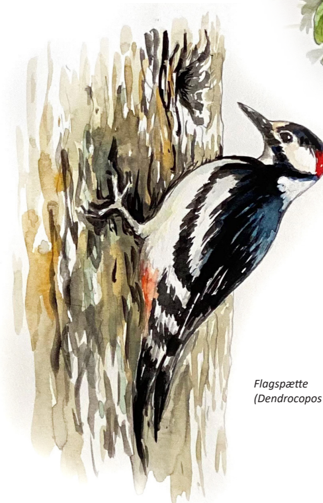
Flagspætte (Dendrocopos major)